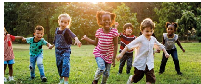
Varhaisvuosien fyysisen aktiivisuuden suositukset, 2016.