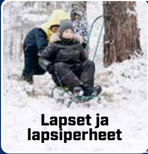
Lapset ja lapsiperheet